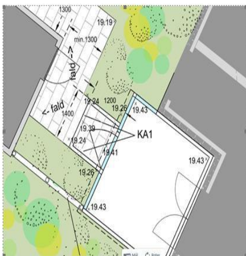
Herover tegning som Rambøll henviser til

Der henvises til 2 forskellige tegninger. Rambøll vil sørge for afklaring på BU-møde 40