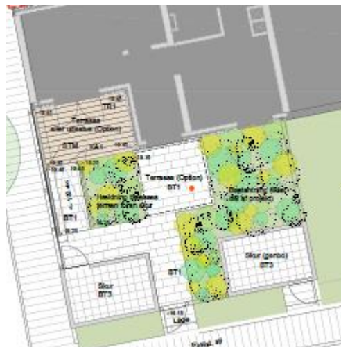
Herover tegning som BU henviser til

b. Dobbelttrampe ved Bryggerlængen 8-10-12, er den godkendt af Albertslund Kommune?